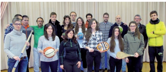
Deportistas y representantes de asociaciones relacionadas con el deporte, el día de la presentación del foro.

K irol eta Jarduera Fisikoa sustatzeko Sailak Barañaingo I. Kirol Foroa eratu berri du. Herritarren parte hartzea handitu eta guztien elkarlana areagotzeko asmoarekin egin du lehen deialdia. Bereziki, jarduera fisikoak prestatzen dituzten ardura-dunekin bat egiteko asmoa izan da nagusi.