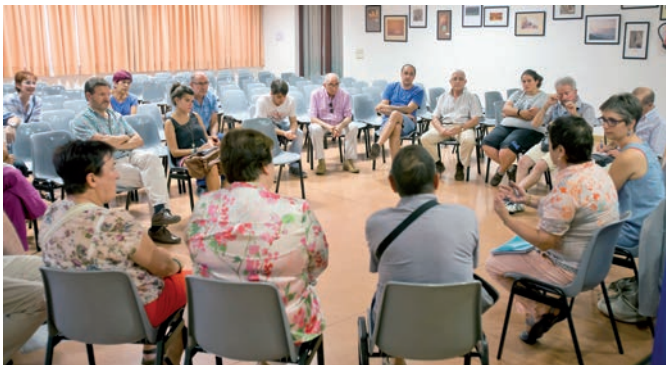
Reunión mantenida con vecinos y vecinas de la pza. de los Castaños.

H irigintza sailak bizilagunen iritziak bildu nahi ditu. Plazetako azpiegiturak hobetzea izanen da ekimen honen lehen pausoa eta bide batez herritarrek dituzten beharretara egokitzea. Joan den abuztuaren 11n bizilagunekin elkartu ziren Castaños plazan eta otsailaren 11n Río Arga ingurukoekin elkartu zen. Batzar horien ondotik zenbait eginkizun abian jarri ditu udalak eta bide hori jarraitu nahi du Barañaingo gainerako auzokideekin elkartu eta erabakiak hartuz.